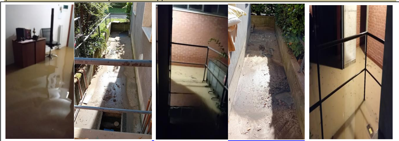
Cordolo esterno che cinto il mio locale colmo di acqua

Alfine risponde pure l'ufficio manutenzione Aler che mi tiene al telefono quasi per mezza ora mai successo quando di norma se ripeto se mi rispondevano mi concedevano esigue parole e pochi secondi di ascolto Signora grazie dell'attento ascolto spero di essere registrato così mi spiego meglio...ormai presumo mi avete soppesato conosciuto a fondo sarò magari un poco tontogna ma di fatto Persona per Bene. Ora dire che stavo meglio quando vivevo nel bosco è 1 bestemmia! Avere 1tetto 1casa ti fa sentire o almeno avere l'illusione di fare parte di Qualcosa o Qualcuno e questo lo devo grazia alle Aler...ma mi creda come mi riferiscono i Vicini e gli stessi vostri Artigiani l'appartamento dove vivo non è idoneo tantomeno salubre poiché ha sempre creato problemi di manutenzione per le infiltrazioni di acqua e relativa umidità che oltre rendere l'ambiente invivibile rovina mobili suppellettili e quel che è peggio la salute: quindi cosa voglio dire da poco sono pensionato aiutatemi a vivere quei pochi giorni settimane mesi o meglio ancora anni che mi rimangano da vivere con un poco di santa Pace come sempre chiedo troppo???